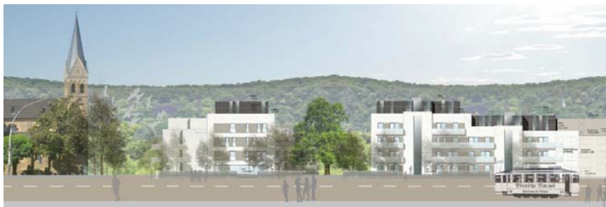
Bild Ansicht Villenstraße