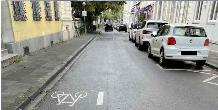
Bild Weberstraße: Bald werden Stellplätze für Bewohner rar gesät sein.