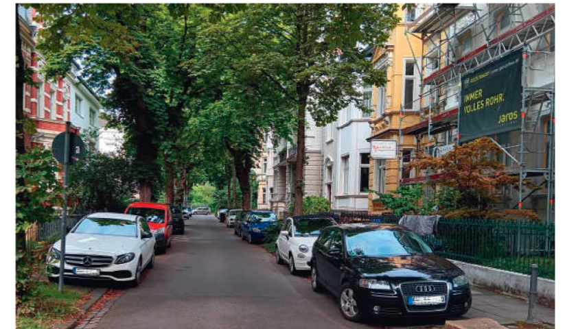
Dieses „gekippete“ Parken halb auf dem Bürgersteig wird verboten.